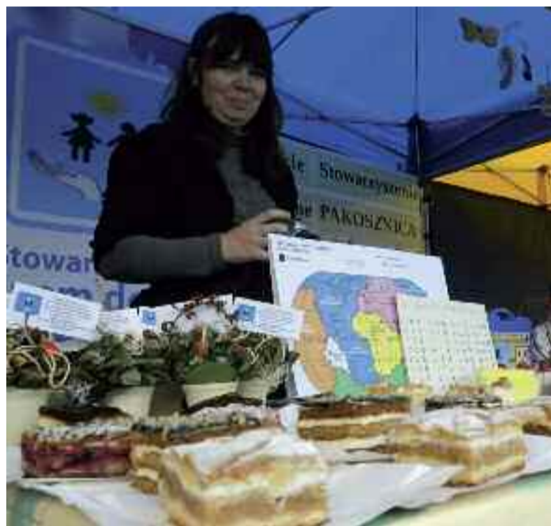
Na festiwalu swoją działalność prezentują zagłębiowskie stowarzyszenia pozarządowe.