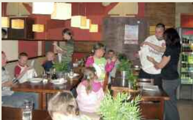
Warsztaty w dąbrowskiej pizzerii.

Dzięki nawiązanej współpracy z Pizzerią Dominium czterdzieścioro dzieci uczestniczyło w zajęciach zorganizowanych przez znakomitych kucharzy.