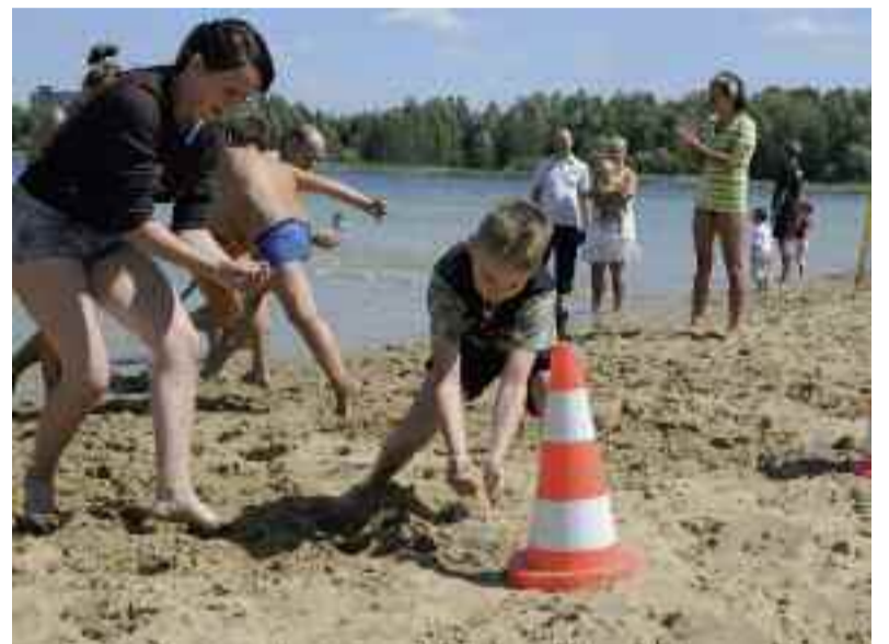
Przystanek Pogoria - jedna z plażowych atrakcji tegorocznego lata.

Nie mniej atrakcyjną niespodzianką czekającą na plażowiczów korzystających z wodnych kąpeli na Pogorii III był zorbing. Tuż przy moło każdy chętny do wodnych zawirowań miał możliwość wypożyczenia nadmuchiwanego kuli wodnej. Fachowa obsługa zapewniała uczestnikom moc wrażeń połączonych z dużą dawką dobrego humoru. Codziennie od