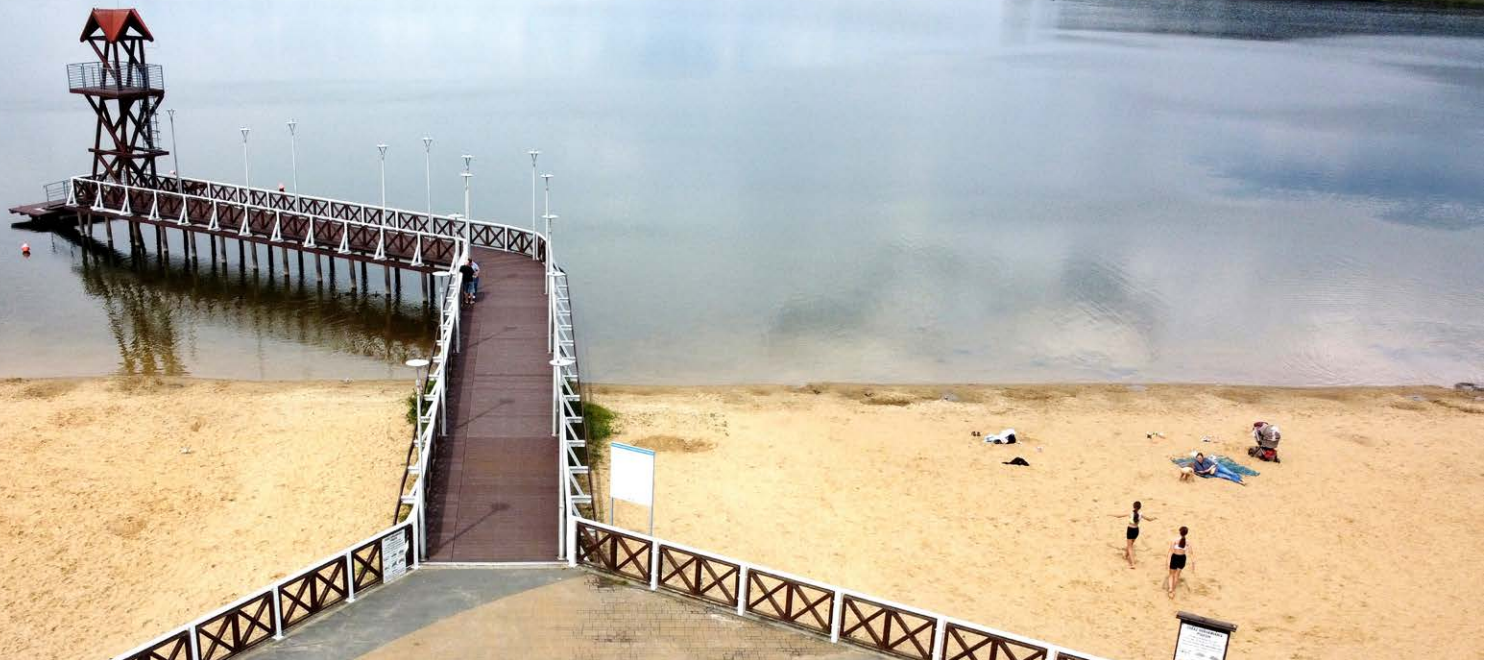
fol. Dariusz Nowak

Jeden z najbardziej charakterystycznych punktów na mapie Dąbrowy Górniczej zyskał m.in. nowy podest, a jego otwarcie zbiegło się z początkiem sezonu kąpielowego.