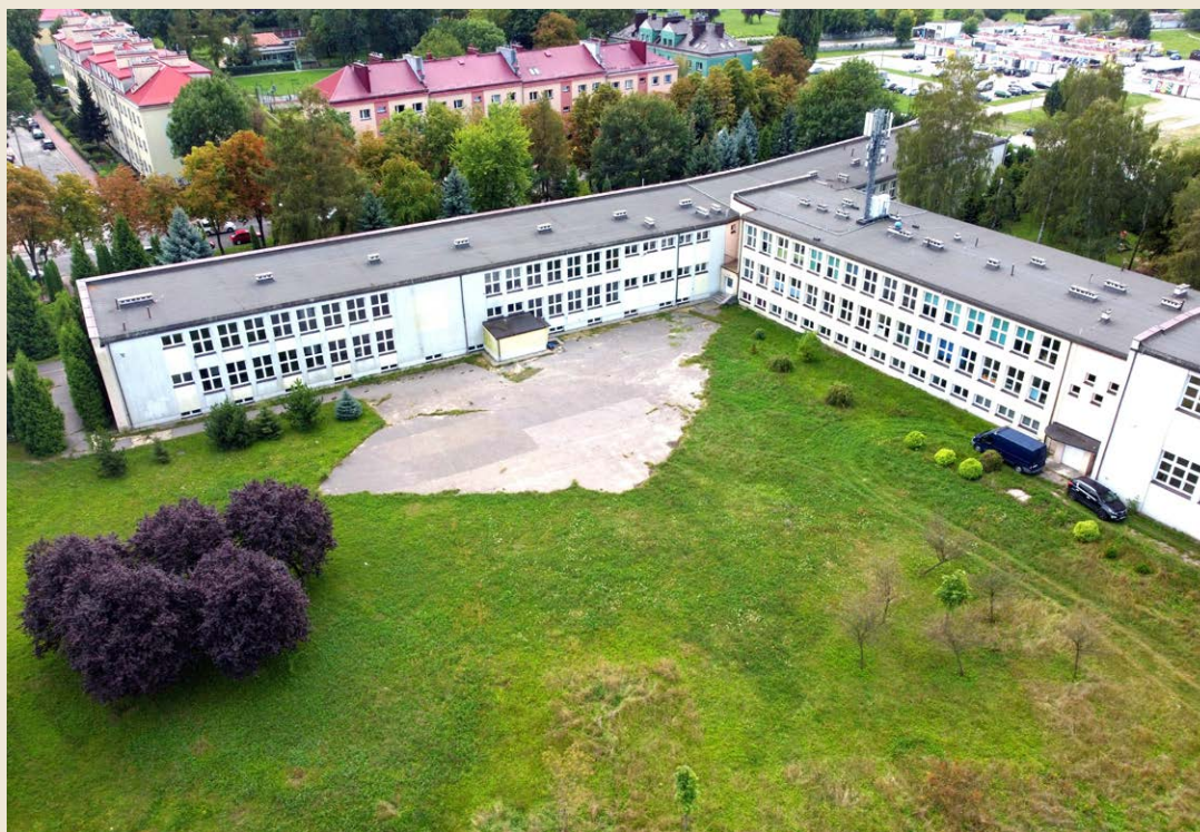
fot. Dariusz Nowak