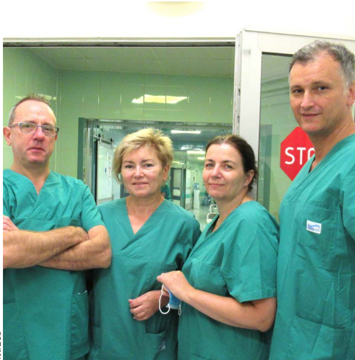
AG fot. ZCO