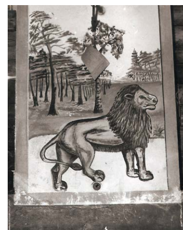
„Bądź śmiały jak lampart, lekki jak orzeł, rączy jak jeleni, potężny jak lew...”. Malowidła z dąbrowskiej synagogi, l. 1939-1945

wiemy dokładnie, jak wyglądało wnętrze dąbrowskiej bóżnicy, ale o dekoracjach malarskich mogą świadczyć zdjęcia malowideł, które prawdopodobnie wykonali Niemcy w okresie II wojny światowej. Pokazują one typowe motywy dekoracyjne dla tych budowli, jak przedstawienia zwierząt (tu: lamparta, orła, jelenia, lwa i byka) oraz widoki Jerozolimy, którym towarzyszą religijne cytaty.