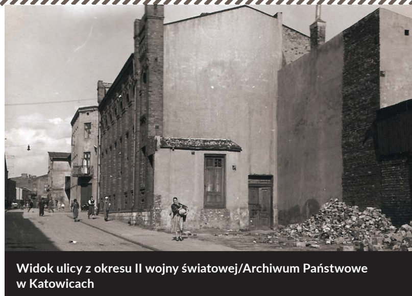
Widok ulicy z okresu II wojny światowej

Budowę głównej dąbrowskiej synagogi rozpoczęto w 1912 r., a zakończono w 1916 r., kiedy ludność żydowska stanowiła około 15 proc. ogółu mieszkańców osady.