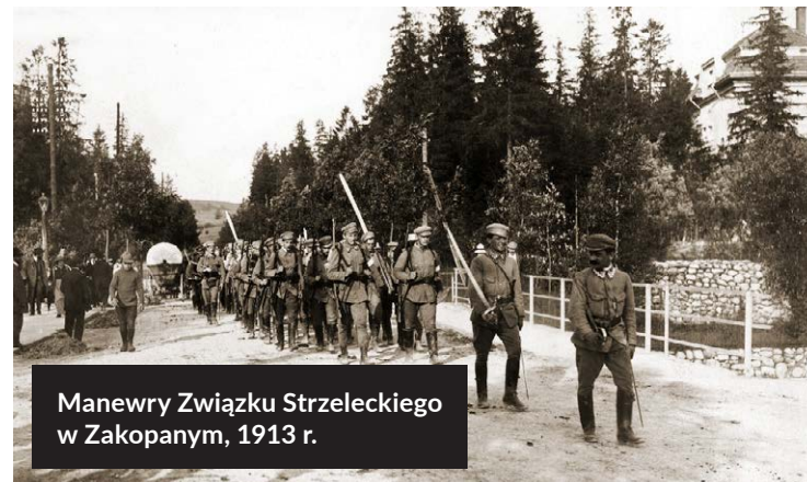
Manewry Związku Strzeleckiego w Zakopanym, 1913 r.