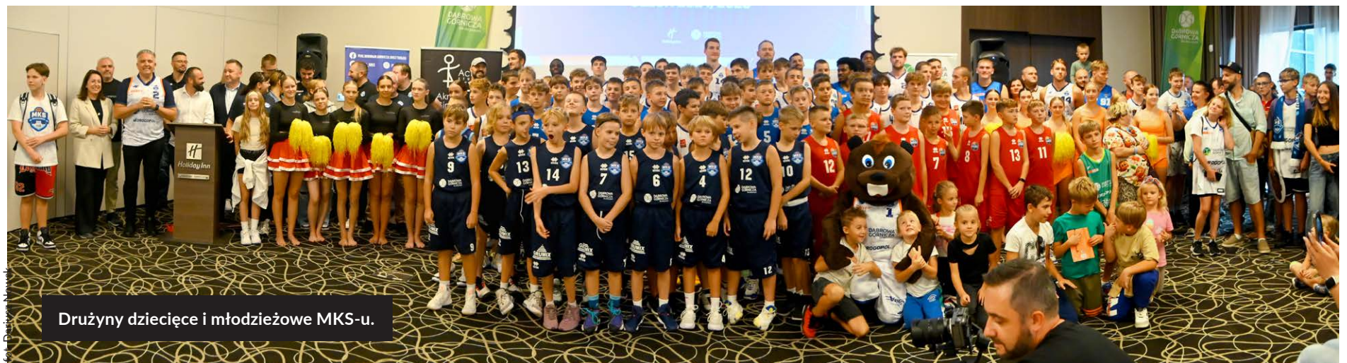
Drużyny dziecięce i młodzieżowe MKS-u.