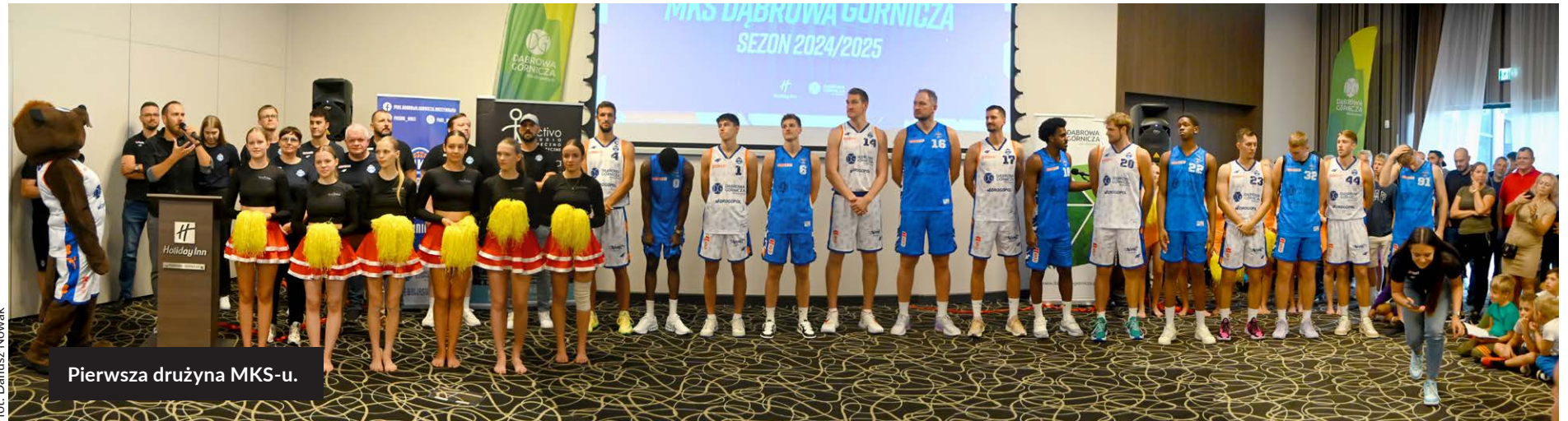
Pierwsza drużyna MKS-u.

W październiku startują rozgrywki Orlen Basket Ligi. Sezon 2024/2025 dla MKS-u Dąbrowa Górnicza będzie jedenastym na boiskach koszykarskiej ekstraklasy. Kibice już niebawem zobaczą, jak zespół prezentuje się w akcji.